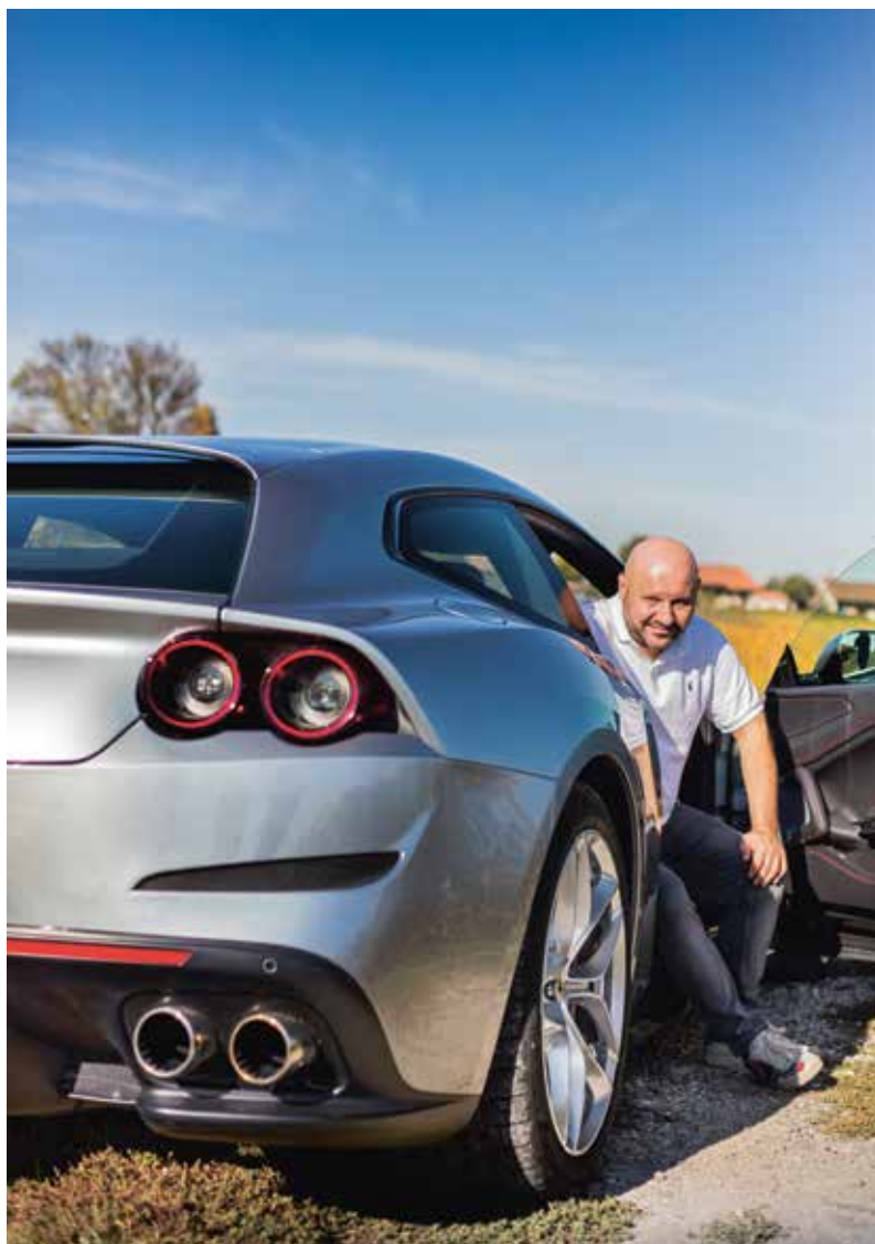
FOTURE | PHOTOGRAPHY